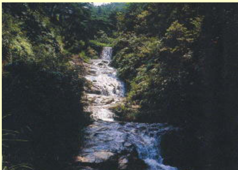
府中町憩の森 水分峡

このコースは、市街地に近く、交通の便も比較的よいので家族連れで気軽に利用できます。コースには、岩屋観音や府中町の憩の森があります。憩の森には水分峡があり、施設も比較的整っています。