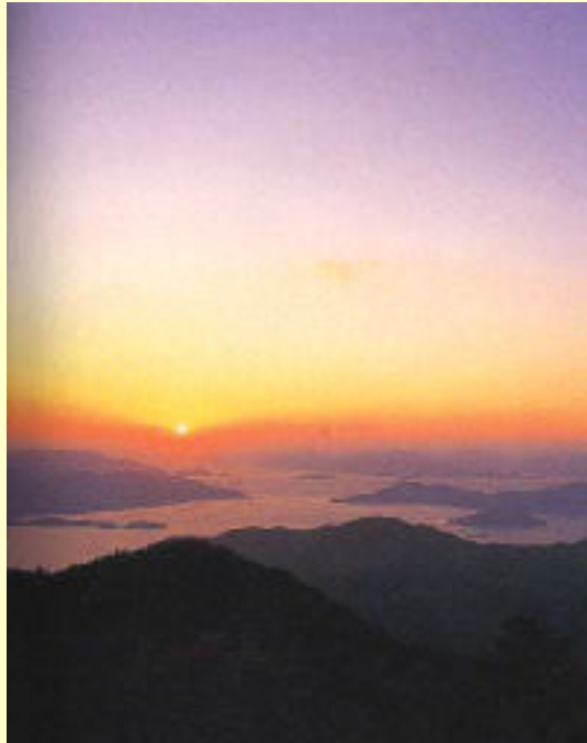
絵下山からの展望